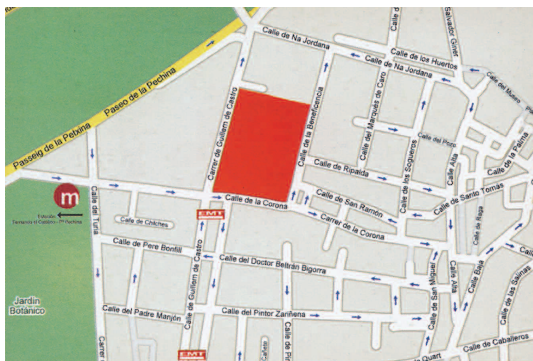
Museu Valencià d'Etnologia. C/ Corona, 36 - 46003 València. Parades de Bus: 5-81